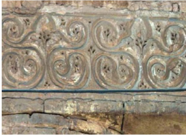
تصویر ۵. گچ بری مسجد جامع اصفهان متأثر از گچ بری سبک سامرا