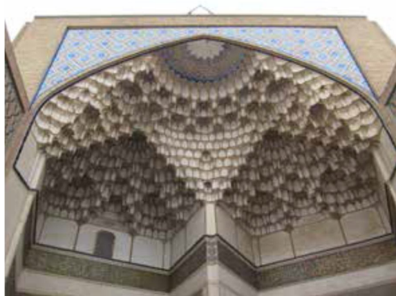
تصویر ۹ مقرنس بندی های گچی تخته به تخته سر در ورودی مسجد کهنه کاشان، دوره تیموری