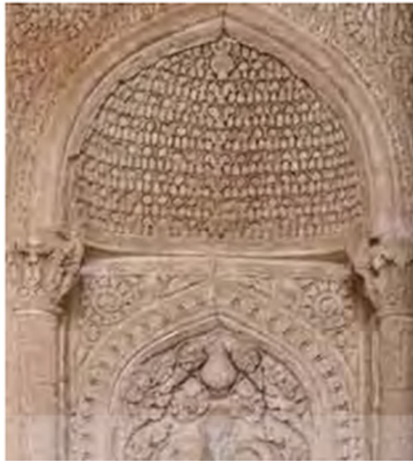
تصویر ۴. محراب گچبری شده مسجد جامع نایین (اعظمی و دیگران، ۱۳۹۲: ۲۰)

معمولا گچ بری ها در این دوره ترکیبی از اشکال هندسی، دوایر یا کثیر الاضلاع ها و یا نقوش گیاهی مانند درخت تاک و برگ مو و خوشه های انگور است که در اغلب موارد با نقوش گچ بری زمان ساسانی و در دوران اسلامی با نقوش گچ بری مسجد سامرا قابل مقایسه است. نقش هشت و چلیپا در این تزئینات جز اولین تزئینات هندسی به این شکل است (احمدی و شکفته، ۱۳۹۰: ۱۳۹-۱۴۰). بازسازی صفحه صاحب در مسجد جامع اصفهان نیز مربوط به دوران آل بویه است طی حفاری های گالدیری ۱ ، در دیوار قبله اولیه این مسجد یک قالب گچ بری همراه با اثر گچ بری و فرورفتگی محراب مشاهده شد (تصویر ۵) همچنین گچ بری های قسمت مقصوره این محراب مانند گچ بری های سامرا شکل گرفته است (احمدی و شکفته ۱۳۹۰: ۱۳۶).