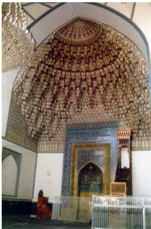
تصویر ۸ مقرنس بندی گچی ایوان مقصوره مسجد جامع گوهرشاد، دوره تیموری