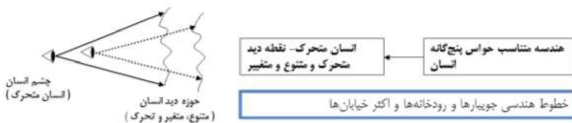
شکل شماره ۱- هندسه مناسب برای حواس پنج گانه انسان؛ (نقره کار، عبدالحمید، ۱۳۹۴: ۷۱)

فراهم نمودن عالم ماده برای انسان، فقط از راه ابزار حواس پنجگانه و با شیوه جستجوی عقلی فراهم می شود. زیرا، می توان به جرأت اذعان نمود که مهم ترین راه ارتباط انسان با فضای معماری و محیط اطراف خود، «حس بینایی» او می باشد. اگر فضا در جهت دید و حس بینایی انسان طراحی گردد، نقطه دید او نیز، می تواند هرچه بیشتر متنوع، متغیر و متحرک طراحی شده، در نتیجه، او به حرکت مادی تشویق شده و نقطه دید او نیز هرچه بیشتر متنوع، متغیر و متحرک می تواند طراحی شود.