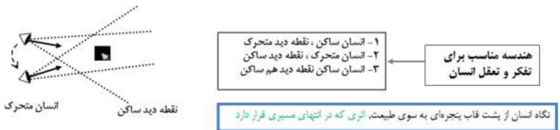
شکل شماره ۲ - هندسه مناسب برای تفکر و تعقل؛ (نقره کار، عبدالحمید، ۱۳۹۴: ۷۲)